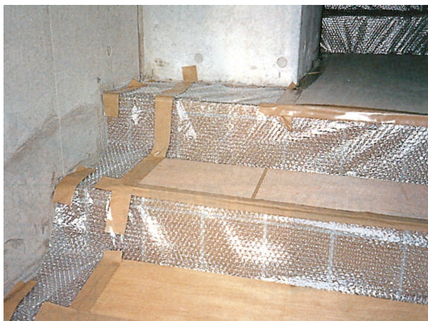
お馴染みの養生材です。