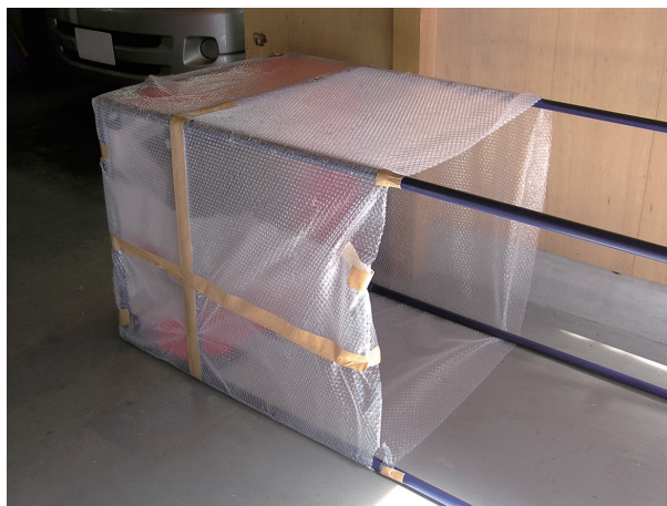
商品をソフトに包み込みます。